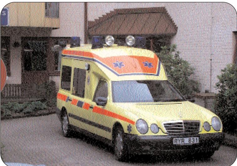
Alvesta och Lessebo är de enda kommunerna i länet som inte har en ambulans stationerad inom kommungränsen. Mycket tid hade varit vunnit om också Alvesta fick en sådan stationering. Vid allvarliga tillbud är tidsfaktorn viktig. En ambulans i Alvesta skulle spara mycket tid. Därför kräver vi en sådan placering.