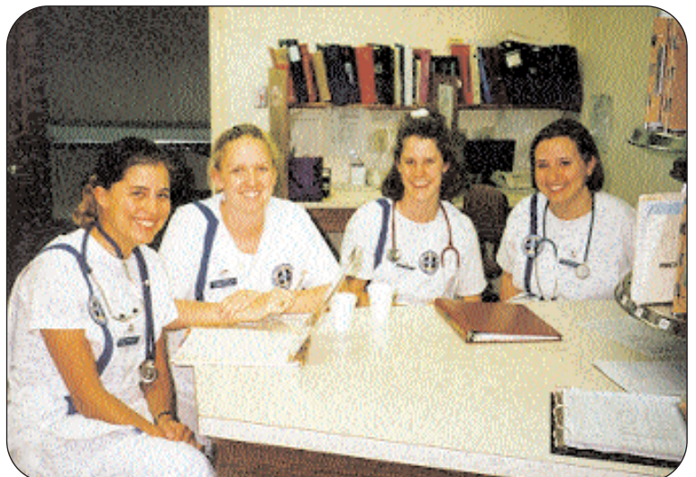
Vårdpersonal är en viktig resurs för kommunen. Deras arbetsförhållanden och trivsel är mycket viktiga angelägenheter för oss så att vi också framöver kan få bemanning på våra vårdinrättningar och inom hemtjänsten.