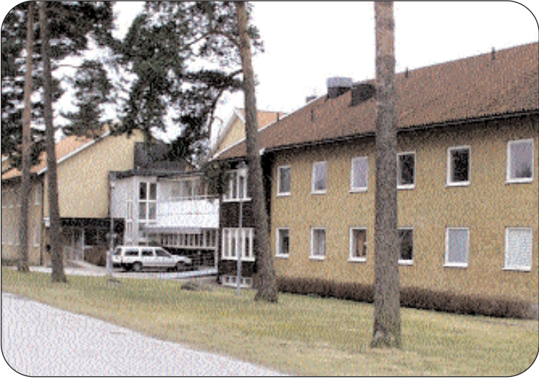
Aringsgården måste kunna utnyttjas bättre än idag. Med ökande behov inom äldreomsorgen blir lokalerna ett billigt alternativ till nybyggnation för exempelvis demensboende.