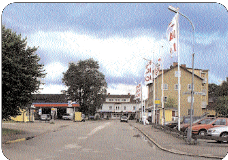
Det är hög tid att Moheda centrum får en ansiktslyftning. I synnerhet om persontrafiken på järnväg kommer igång på nytt. Beslut har fattats men än har ingen ombyggnation påbörjats.