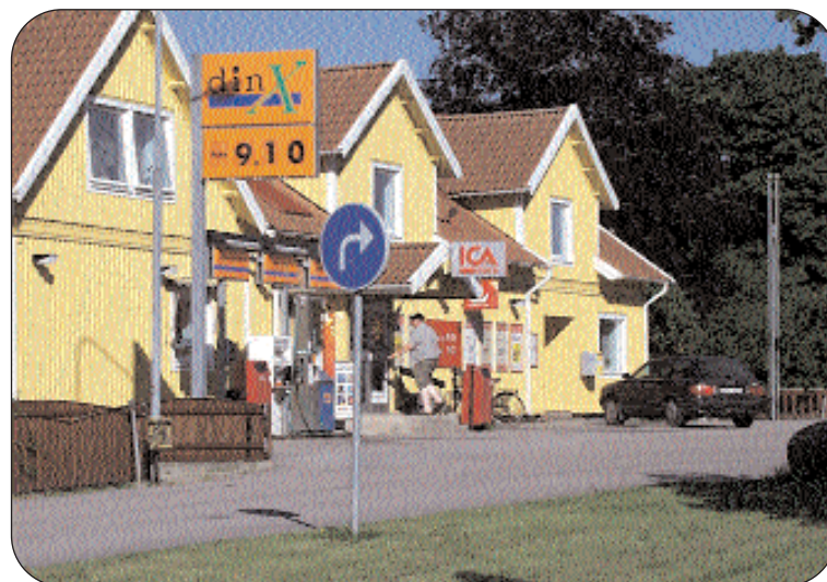
Grimslövs centrum har under flera valröreser varit på tapeten. Så också denna. Nu måste verkligen något hända om inte politikerna skall mista all trovärdighet. Återstår att se om det nu blir tredje gången gillt.

VÄLJ ALVESTA ALTERNATIVET DEN 15 SEPTEMBER