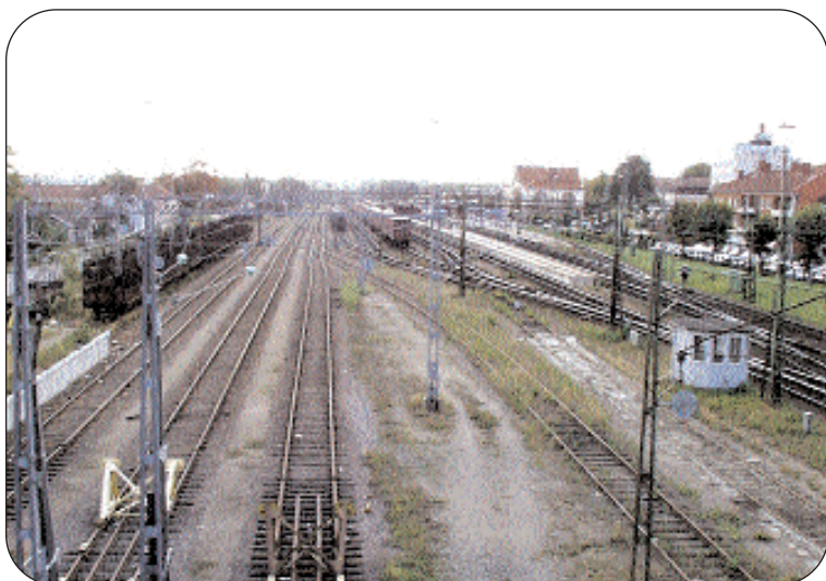
En utflyttad bangård skulle ge stora utvecklingsmöjligheter inte bara för godstrafiken. Nuvarande bangårdsområdet kan inte bara ge välbehövliga parkeringsplatser utan också öppna upp möjligheten för kontorsbyggnation.

Lägg din röst den 15 september på Alvesta Alternativet!