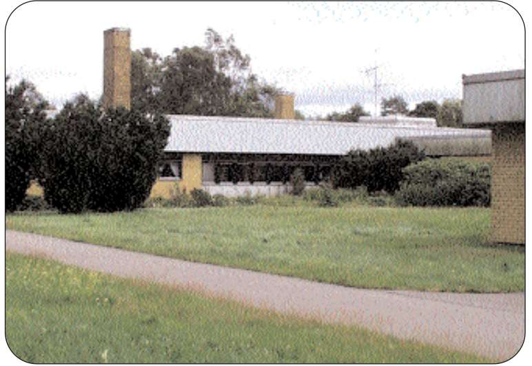
Det gamla konvalescenthemmet på Hamrarna har under en tid fungerat som lägrishotell. Ett utomordentligt objekt för kommunen att inhandla för användande som korttidsboende och i samarbete med landstinget till konvalescentplatser.