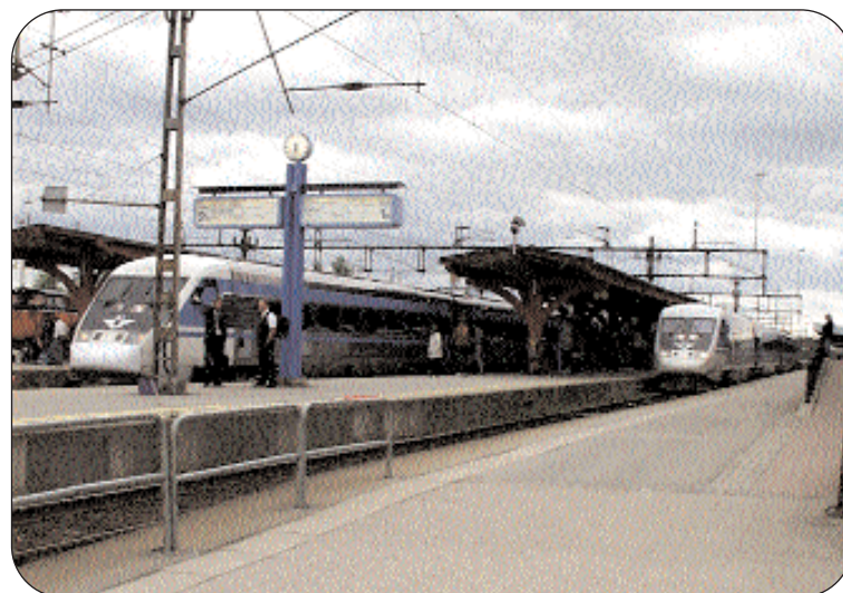
Med en utflyttning av bangården skulle persontrafiken få utomordentliga möjligheter att expandera. Redan nu är bristen på tåglägen vid perrongerna uppenbar. Den nya Jönköpingstrafiken får vid några tidpunkter vänta på linjen i brist på plats.